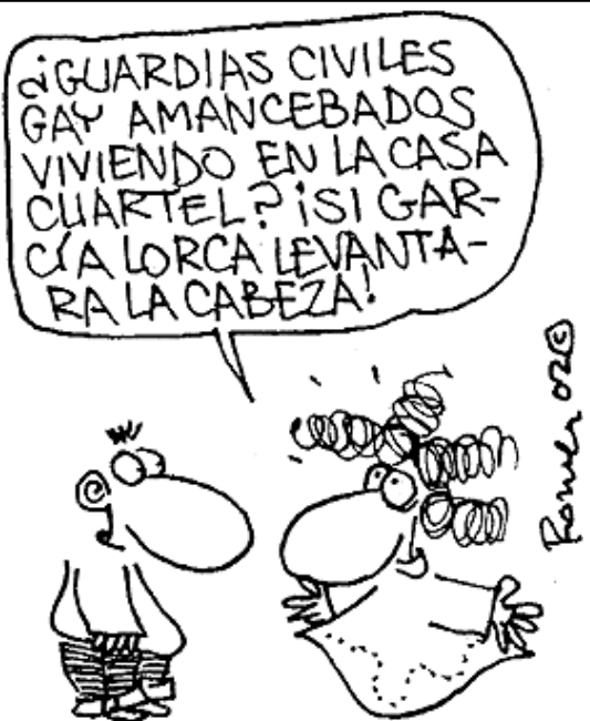
Vinyeta de Romeu publicada al diari El País

Tot açò, unit a la concepció que és possible la pràctica del sexe de forma divertida, plaent i alhora responsable, fan necessària una implicació social i institucional ferma i sense fissures, mitjançant la qual podem portar la nostra societat cap a un futur més encoratjador, solidari i de progrés.